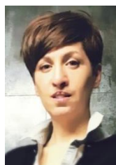
infirmière en soins intensifs