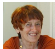
Enseignante spécialisée fondatrice du GSBF