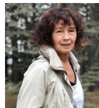
Consultante en pédagogie fondatrice du GSBF