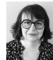
Conseillère technique ,ES Secrétaire-adjointe