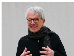
Auteur de l'approche