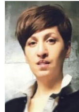
Infirmière en soins intensifs