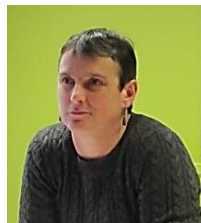
Psychomotricienne Relations internationales