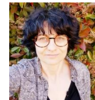
formatrice, biographe Présidente du GSBF