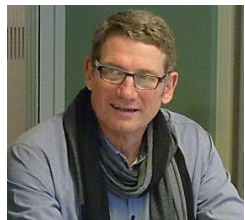
kinésithérapeute, ostéopathe Vice-Président